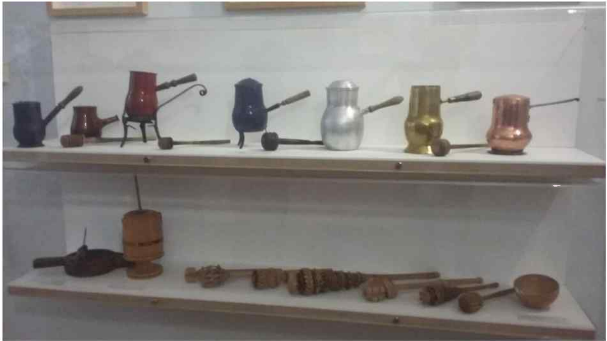
Jimenez de Jamuz y el museo de la Alfarería