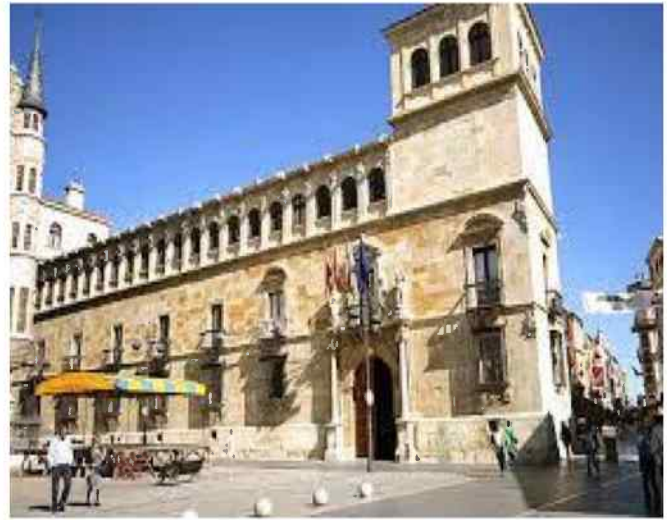
Palacio de los Guzmanes Diputación Provincial de León