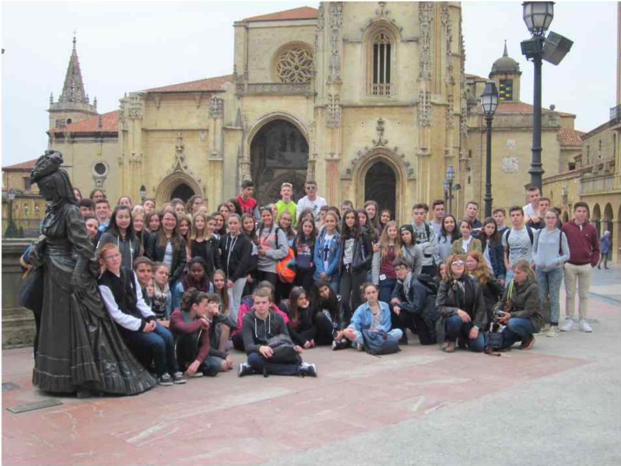
con la estatua de la Regenta delante de la catedral de Oviedo / avec la statue de la Regenta devant la cathédrale d'Oviedo.