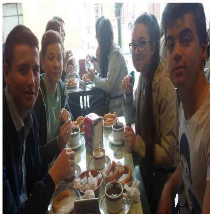
Chocolate con churros. Hum ¡qué bueno !

A Jimenez de Jamuz nous avons visité le musée de la poterie. Le guide nous a expliqué comment on faisait la poterie artisanale, comment on la cuisait et ensuite il nous a fait une démonstration. Il nous a posé des questions et a récompensé certains avec des petites poteries. Pour finir il nous a posé une colle, il s'agissait de trouver la bonne façon pour boire à une jarre pleine de trous. C'était un piège !