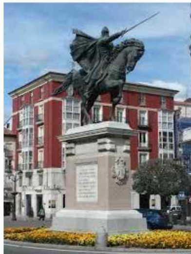
Estatua del Cid