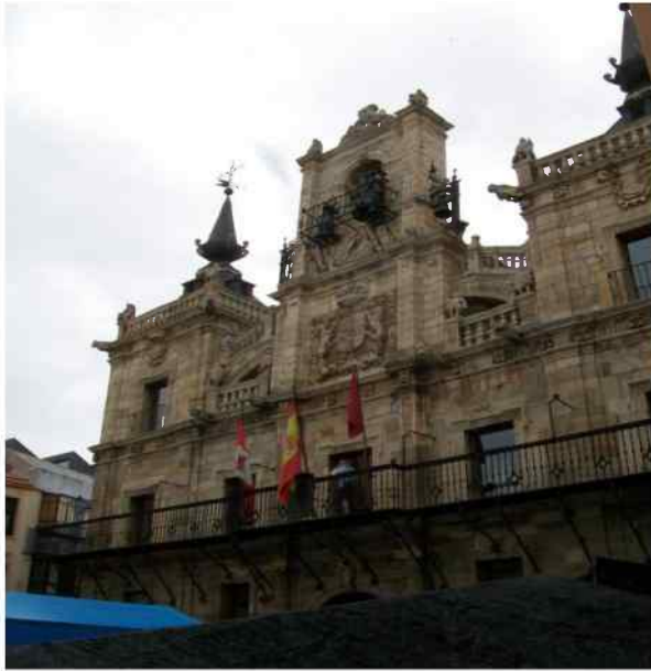
Ayuntamiento de Astorga / Mairie