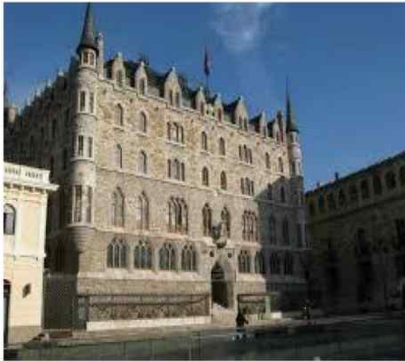
Casa Botines creación de Gaudí