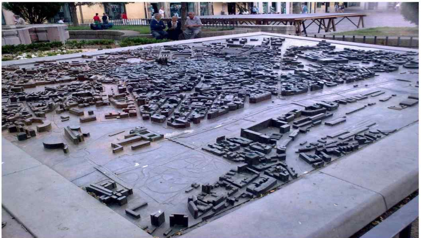
Maqueta de León