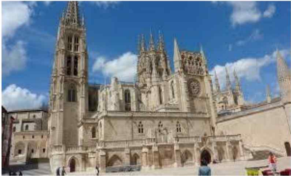
Catedral de Burgos