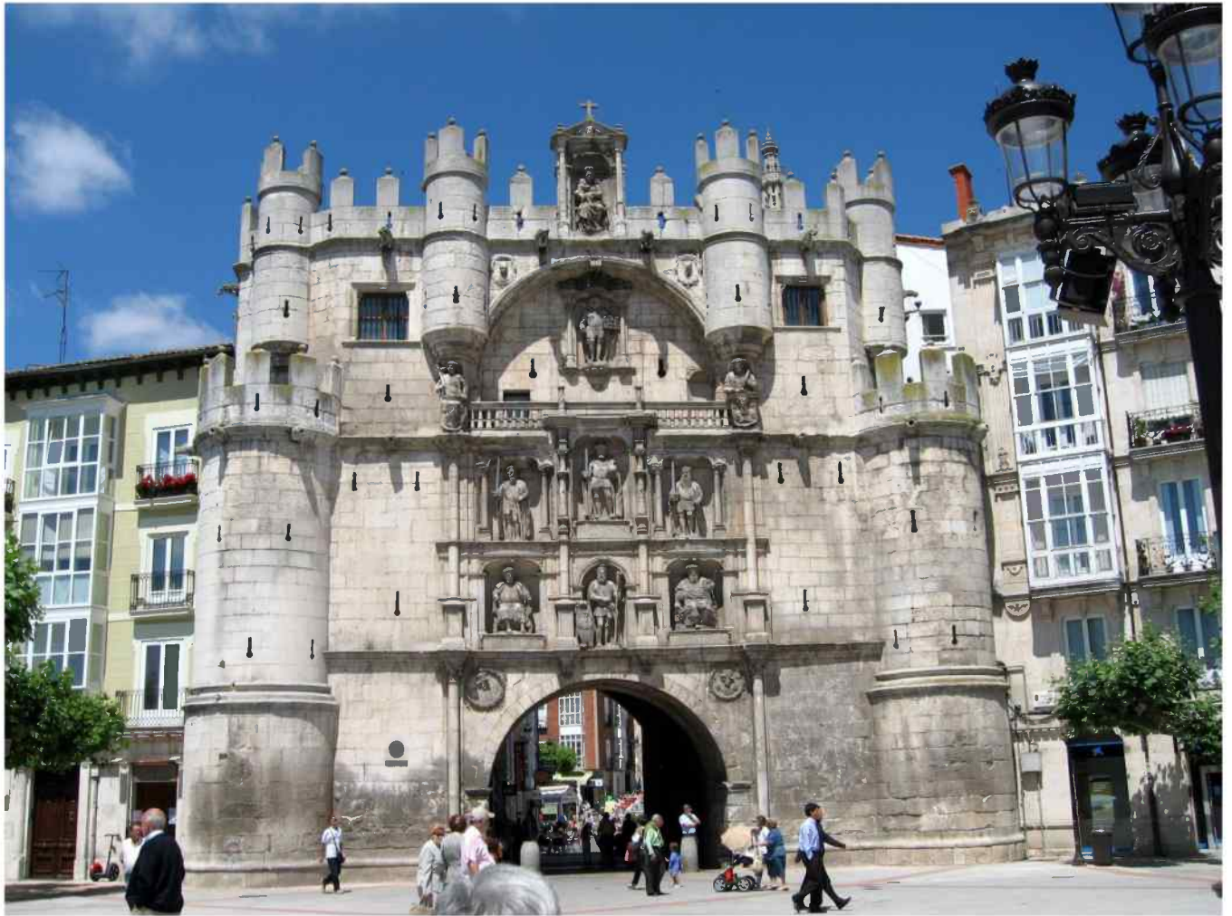
Arco de Santa María