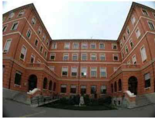
Colegio Divina Pastora

Chacun part avec son correspondant et va se reposer un peu.