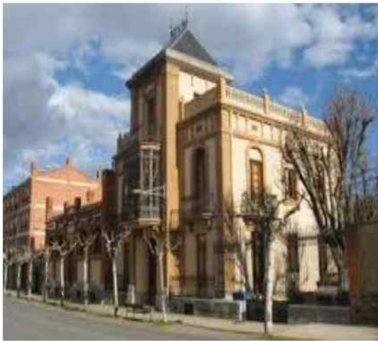
en el museo del chocolate