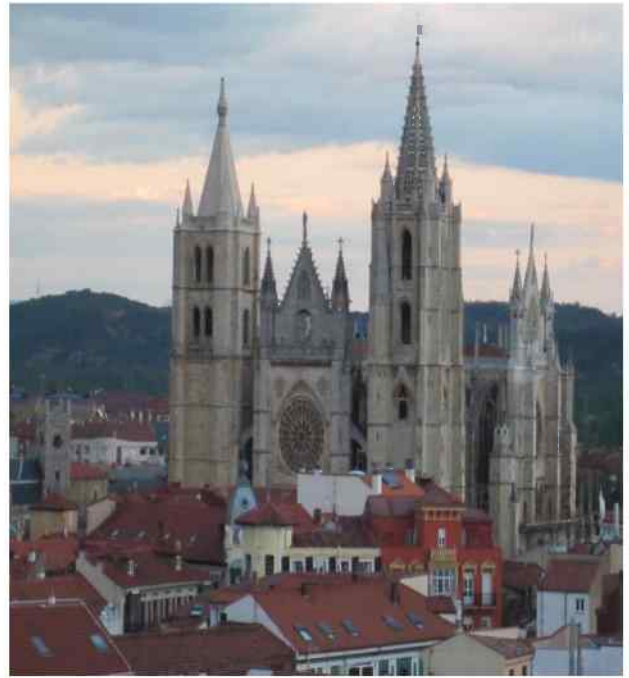
Catedral de León