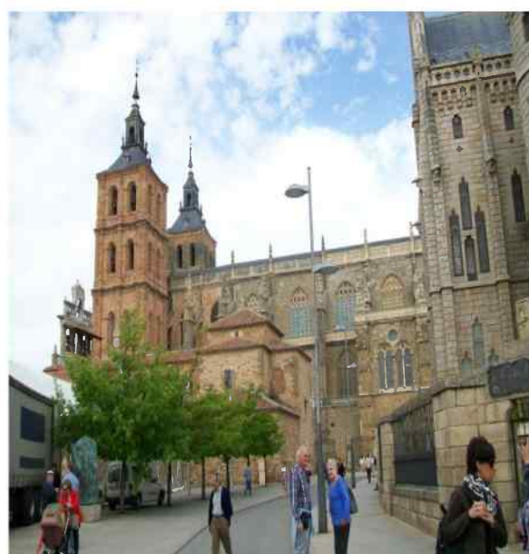
Catedral de Astorga