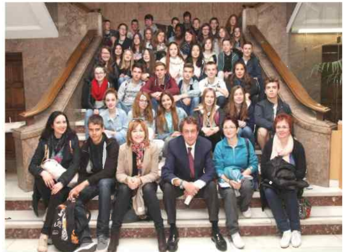
En el ayuntamiento.