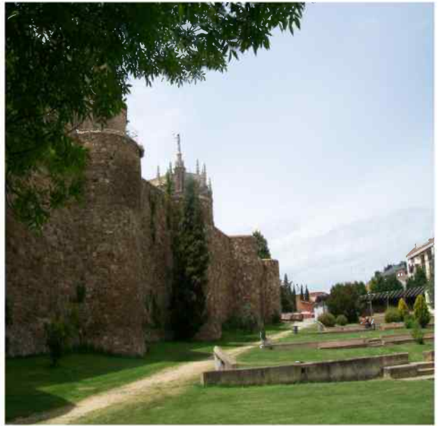
muralla y parque