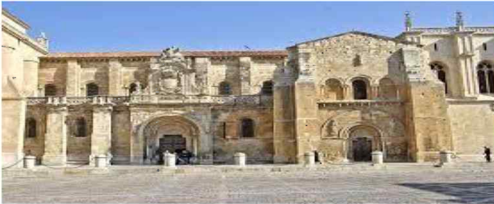
Basilica de San Isidro