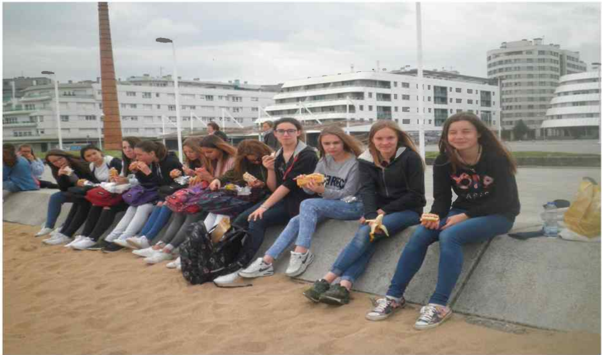
Descanso para comer.